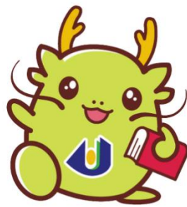
マスコットキャラクター 「オロリン」