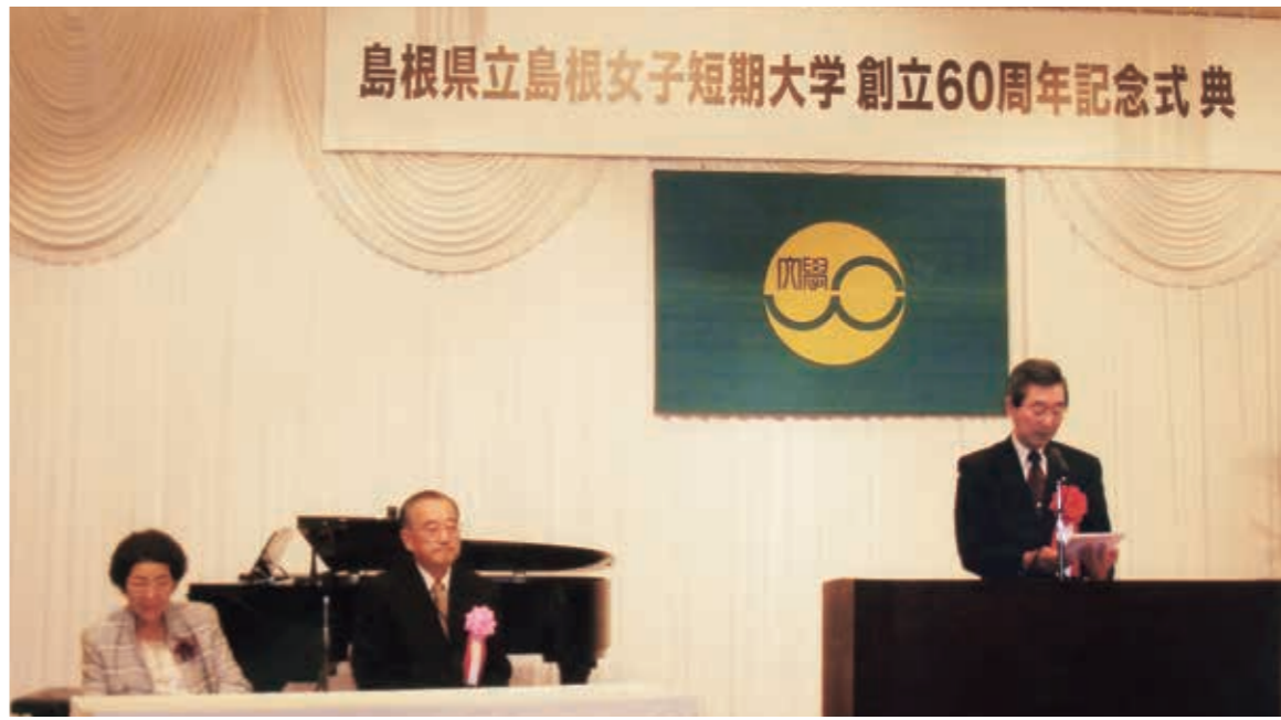
松尾副知事をお迎えしての式典