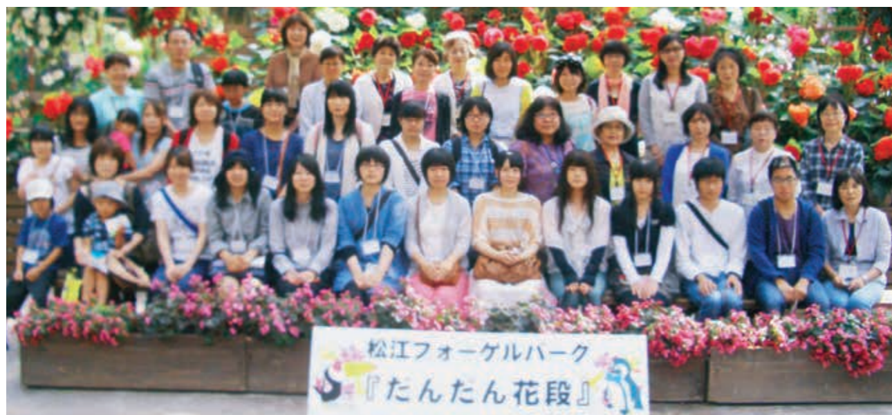
在学生との交流バスツアー初めての試み