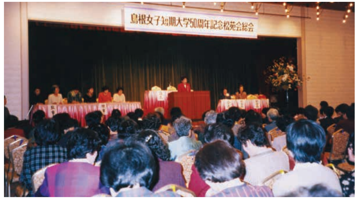
会場に入りきれないほど盛況！