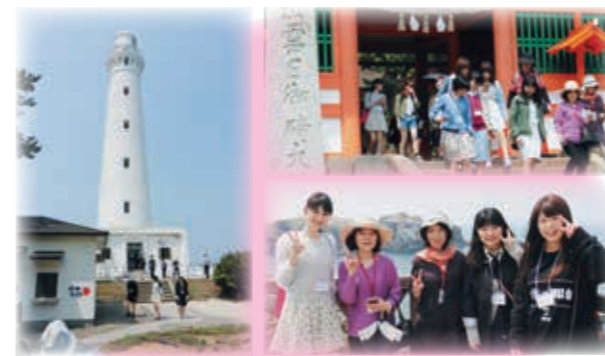
日御碕神社、日御碕灯台周辺