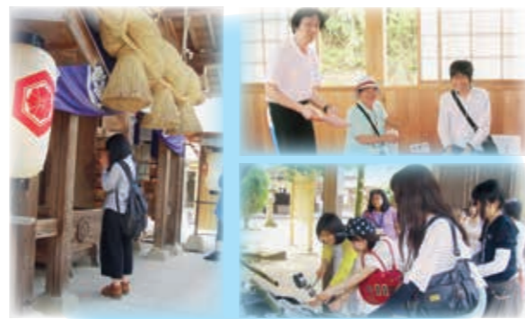
八重垣神社、玉作湯神社