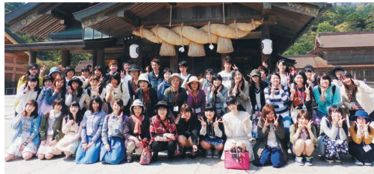
前年度のバスツアーが好評で参加者が増えました