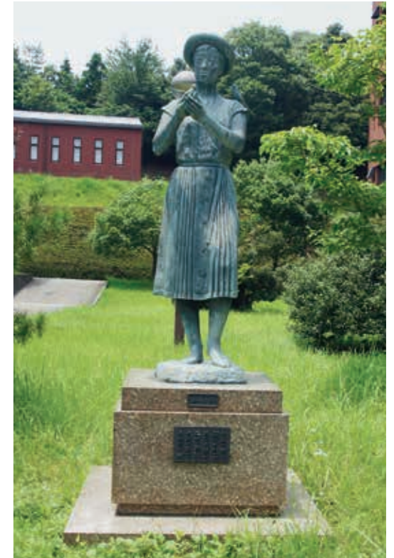
「小鳥の詩」 平成元年10月 島根県立保育専門学院卒業生 贈