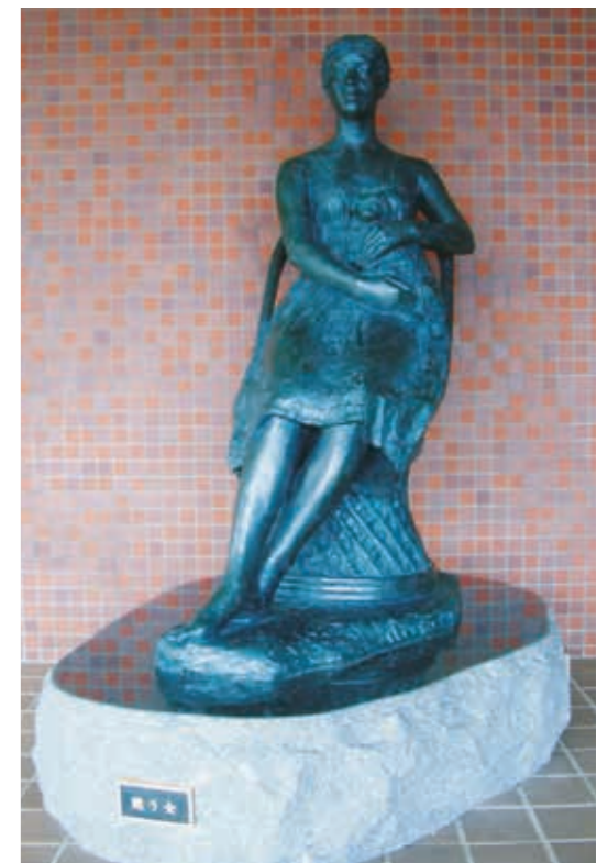
「愁う女」 平成18年11月 島根女子短期大学 松苑会 贈