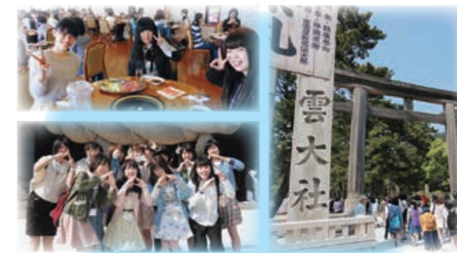
出雲大社、島根ワイナリー