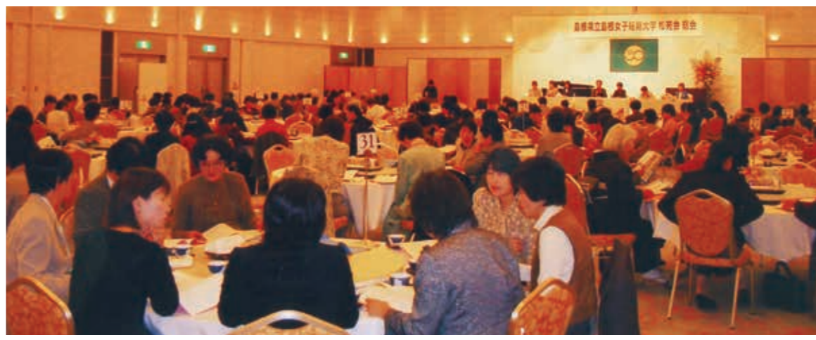
なごやかな雰囲気