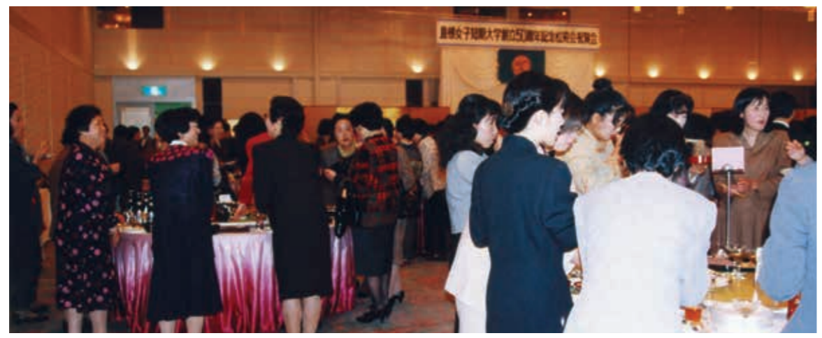
久しぶりの再会で賑わう